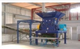
一軸式万能破砕機

廃プラスチックから紙くず、木くずと、様々な廃棄物を破砕処理できる万能型破砕機です。